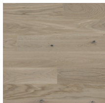
Moskus Parkett Storhaug Eik Sand