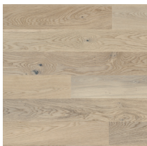
Moskus Parkett Storhaug Eik Hvit